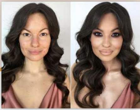
Kurs nr 5 Opadająca/azjatycka powieka, cera trądzikowa Czas trwania: 2:24 h