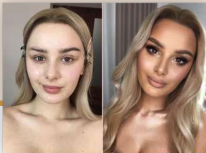
Kurs nr 7 Pink Bridal Smokey Eyes Czas trwania: 2:12 h