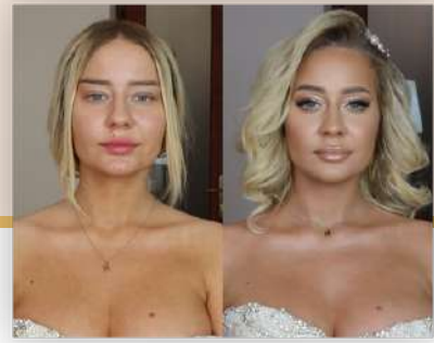
Kurs nr 6 Nude Bridal Make Up Czas trwania: 2:18 h