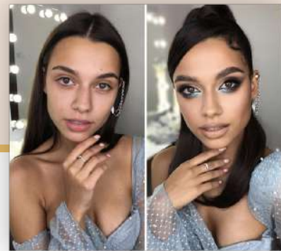
Kurs nr 8 Smokey eyes with pop of blue Czas trwania: 2:33 h